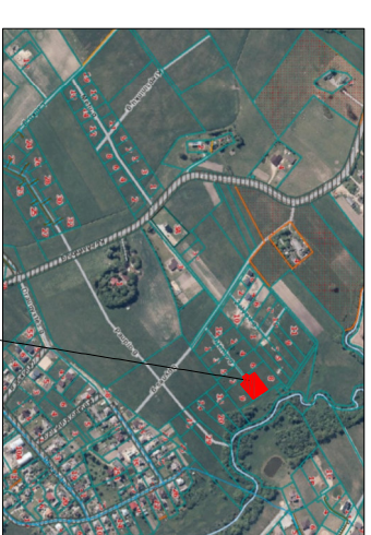
Planuojamas žemės sklypas