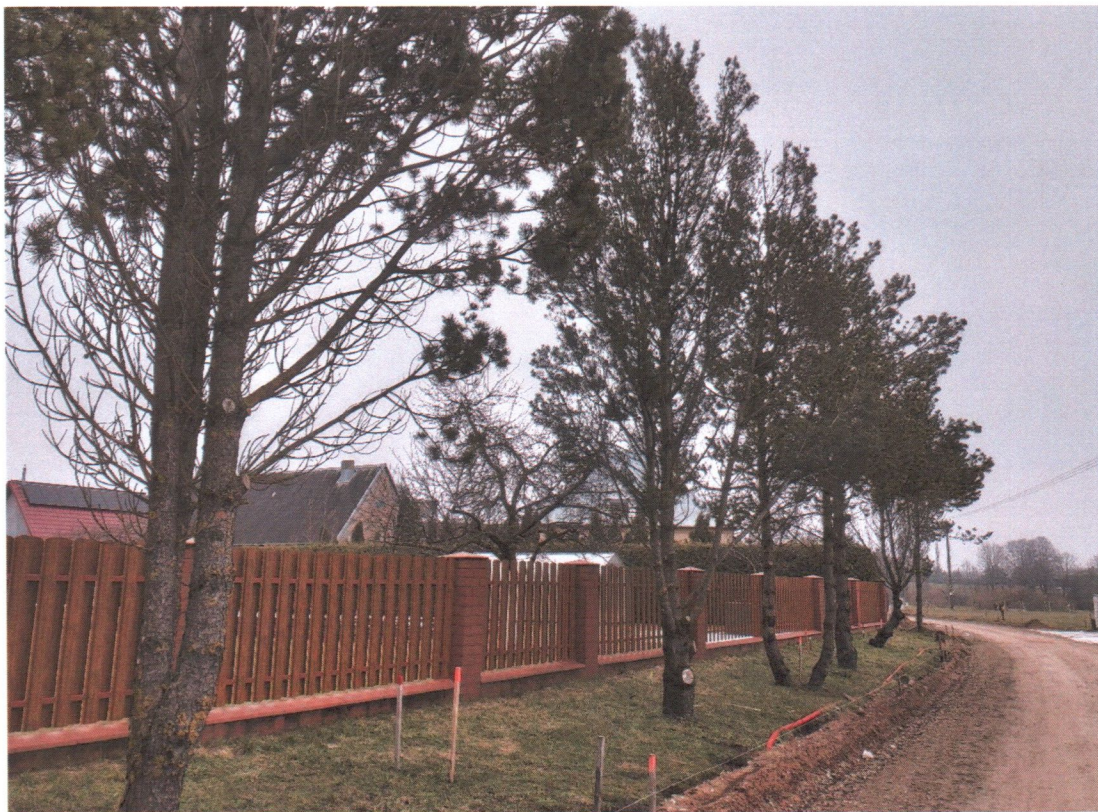
Pušys Nr. 9-15