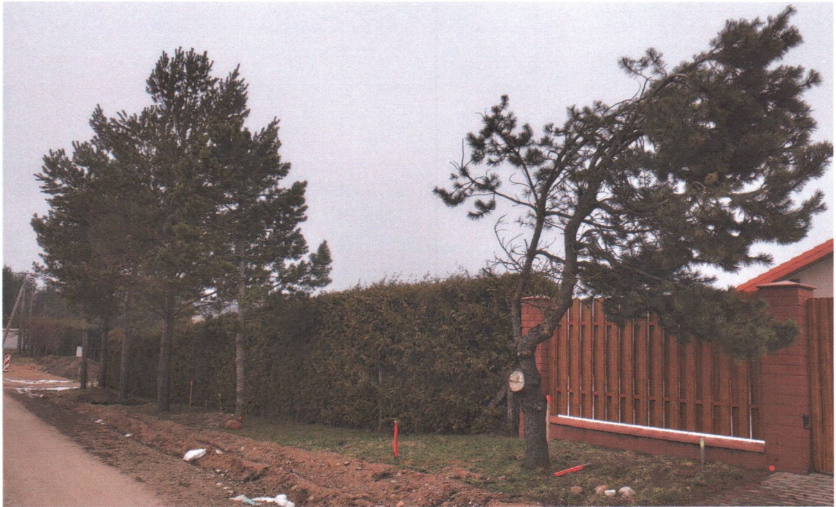
Pušys Nr. 1-6