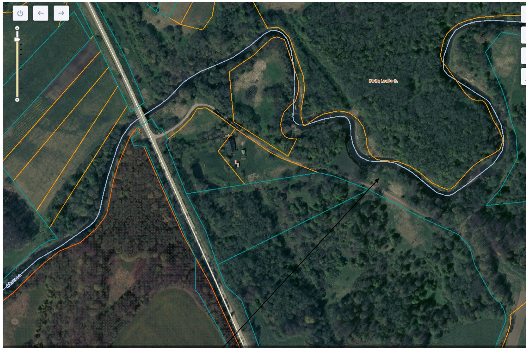
Šilalės rajono sav., Šilalės kaimiškoji sen., Vaičių k. – 0,30 ha, centro koordinatė x- 6149358 y – 389548.