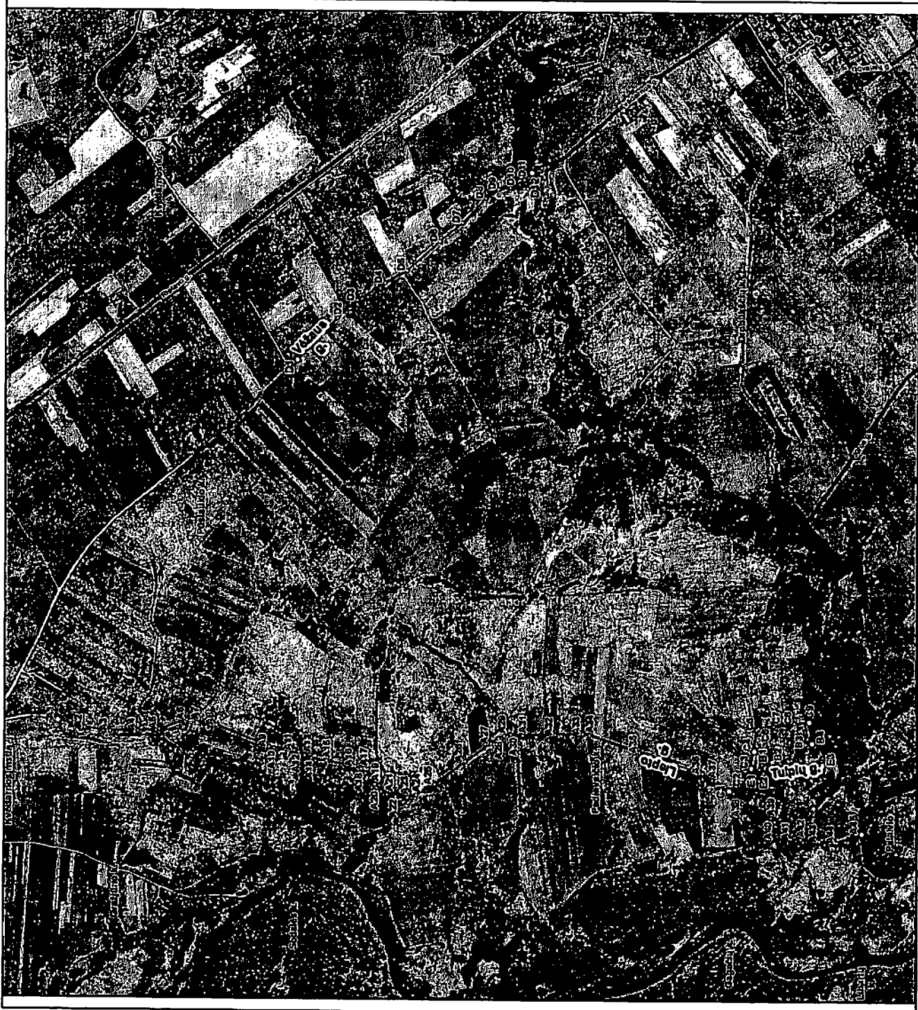
Dokumentą parengė: vyriausioji specialistė Alda Budrikienė