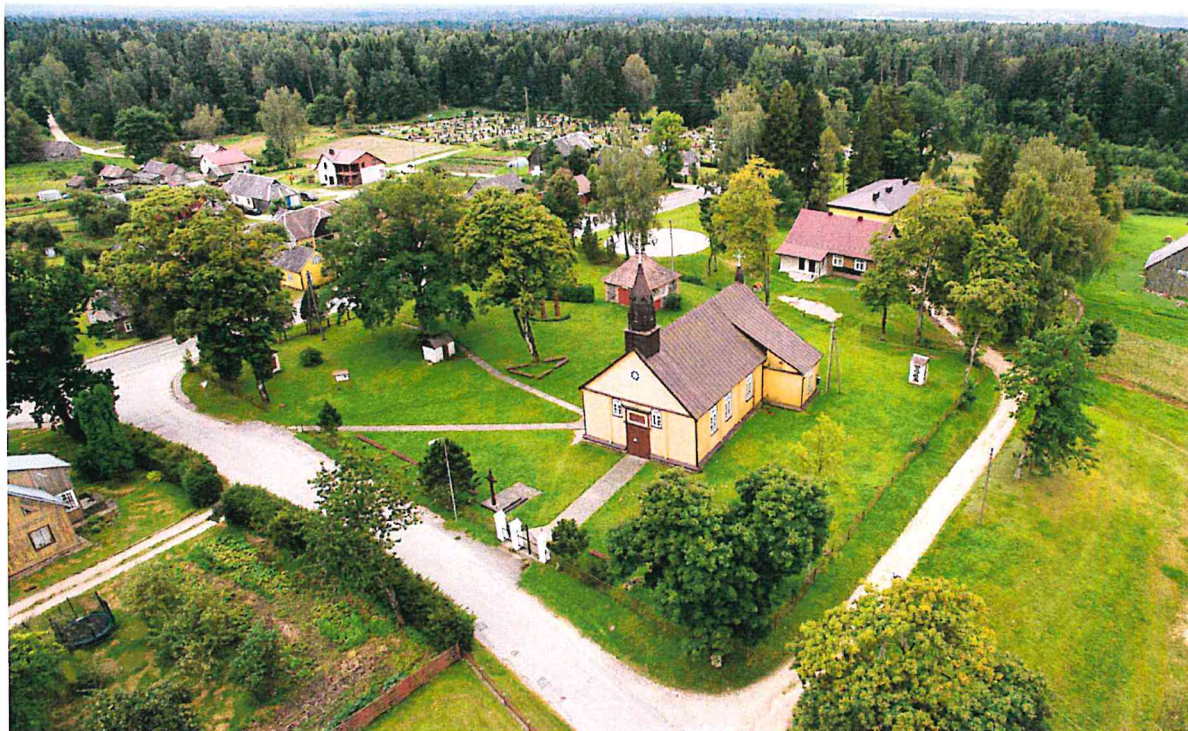
Tūbinės iš paukščio skrydžio